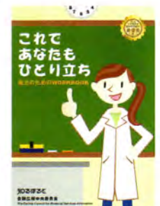
— 指導書・電子教材 —