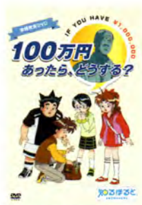
— 中学生向け —