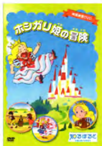
— こども向け —