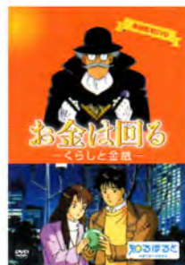
— 一般向け —